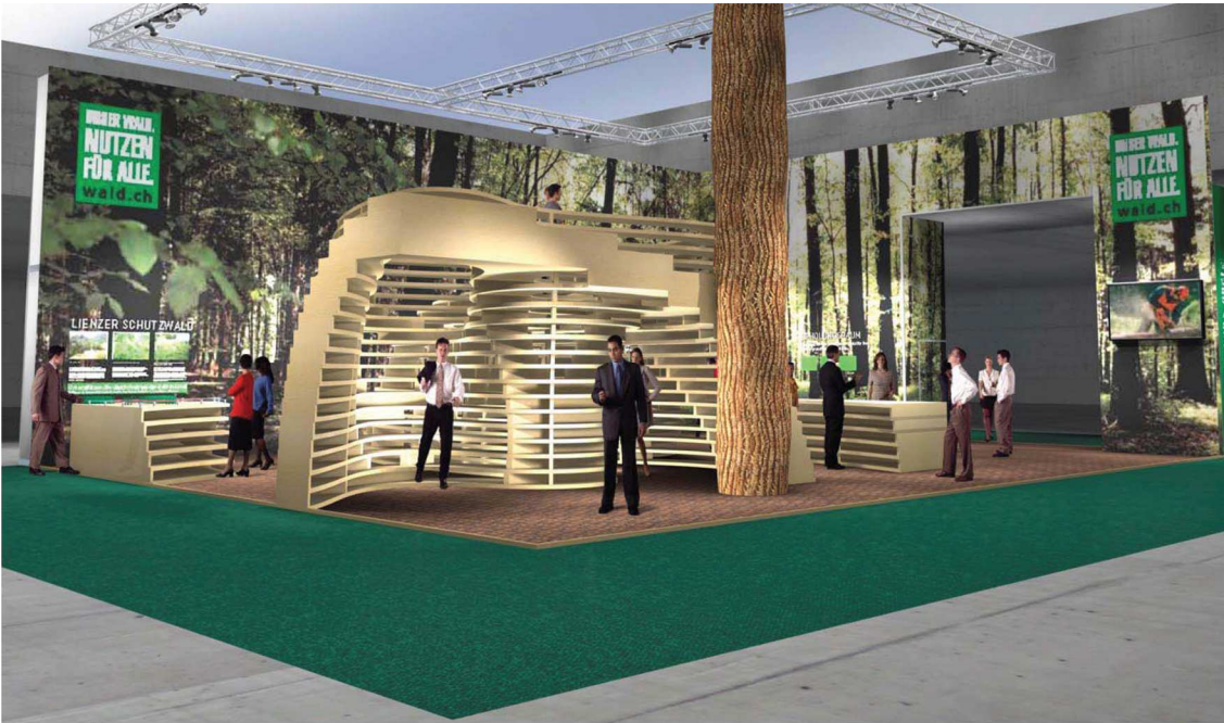
Download unter www.wald.ch → OLMA 2010